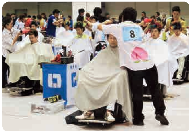
全国理容競技大会

なお、全国大会は11月21日、高知県で開催され岡山県選手も表彰台に上がりました。