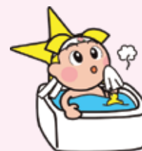
岡山県マスコット ももっち