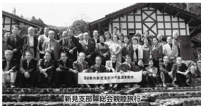
新見支部 総会親睦旅行