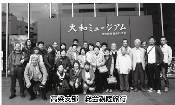
高梁支部 総会親睦旅行