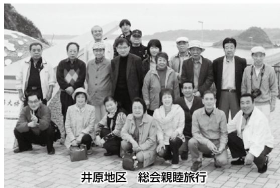
井原地区 総会親睦旅行

平成25年度通常総会が各支部・地区で3月末から4月に集中して開催された。会場は各支部内施設にて開くところと移動総会にて親睦を図りながら開催する地区もあった。各支部・地区の総会は、多数の組合員参加のもと組合員各位の声を聞かせていただく重要な行事である。また、平素顔を見せない組合員とも親睦を図る場でもある。お互い顔を見て話し合うという「絆」ができる会でもあると思います。組合員が高齢化し、減少している現状を組合員各位で考慮し組合をもり立てていきましょう。理容組合に「力」を下さい。