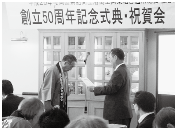
6月18日(水) ワシントンホテルプラザ

昔の話に花を咲かせながら、組合の発展を誓い次の100年に向かって新たなスタートを切りました。