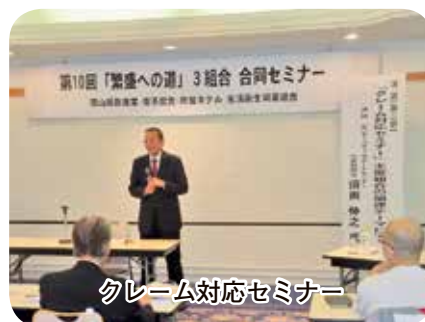
クレーム対応セミナー