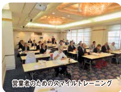
営業者のためのスマイルトレーニング