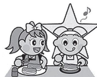
岡山県マスコット「ももっち」と「うらっち」