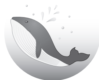
岡山城 (別名 烏城)